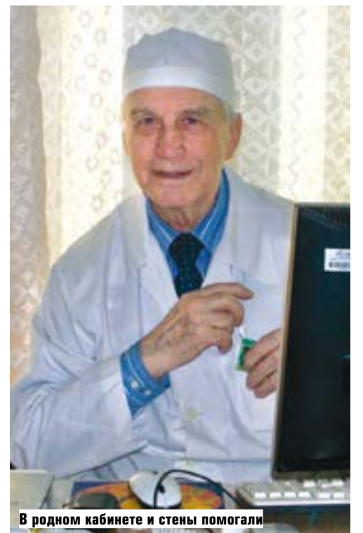
В родном кабинете и стены помогли

«Военно-медицинская газета» Апрель 2021 Издатель: ФГБУ «3 ЦВКГ им. А. А. Вишневого»