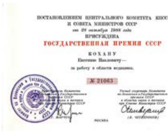
Диплом лауреата Госпремии СССР. 1988 г.