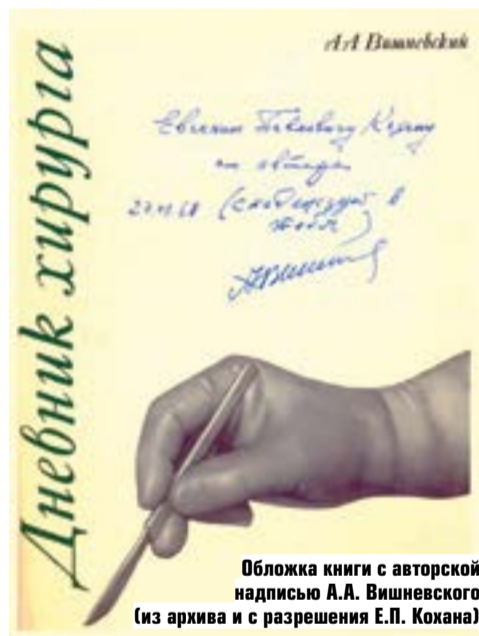
Обложка книги с авторской надписью А.А. Вишневого

На труды врачей госпиталя стали ссылаться в международных изданиях. Так, статья Е.П. Кохана, О.В. Пинчука, В.Е. Кохана, посвященная люмбалльной симпатэтомии в комплексном лечении облитерирующего атеросклероза, была процитирована в следующих изданиях: