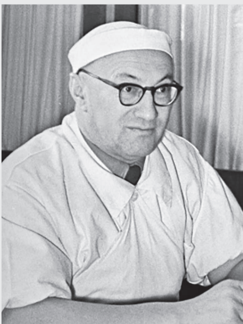
А. А. Вишневский

Вишневский Александр Александрович (11.05.1906 — 19.11.1974), генерал-полковник медицинской службы, с 1956 по 1974 годы — главный хирург Министерства обороны СССР.