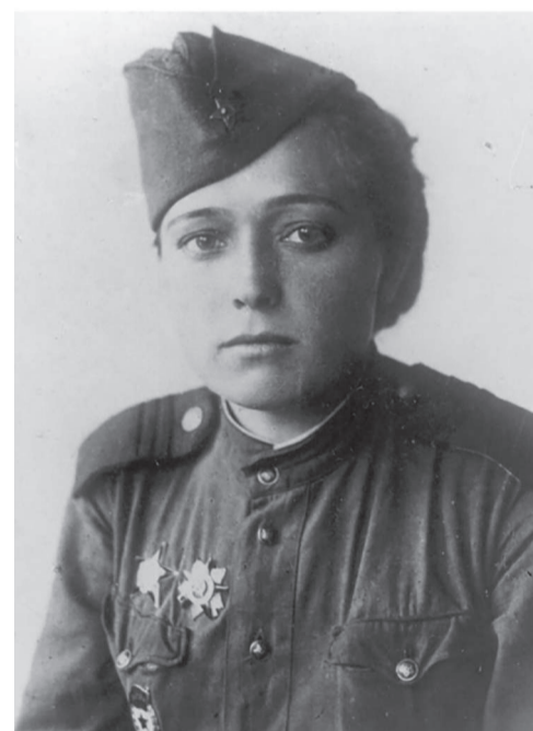
Юлия Друнина в годы войны

И откуда взялось столько силы Даже в самых слабейших из нас?.. Что гадать! — Был и есть у России Вечной прочности вечный запас.