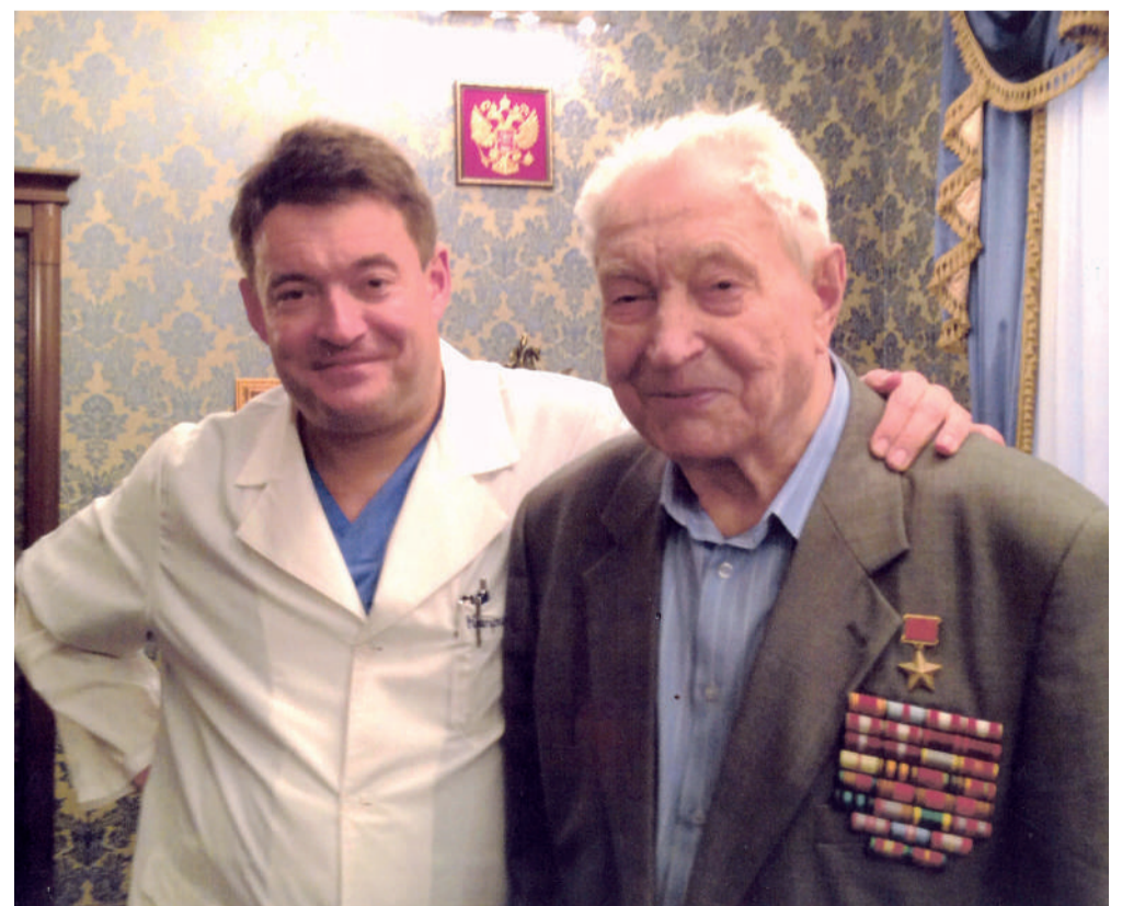
Отец и сын Каприны

— Честно говоря, особого желания не было. Хотя мать хотела, чтобы я стал во-