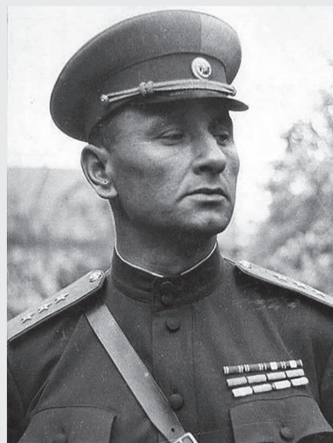
А. А. Гречко

Герой Социалистического Труда (1966), Лауреат Ленинской премии (1960) и Государственной премии СССР (1970).